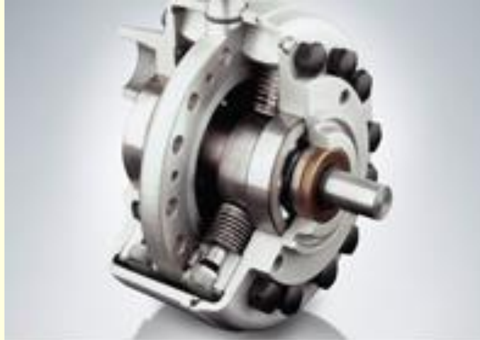
Radyal Pistonlu Pompalar